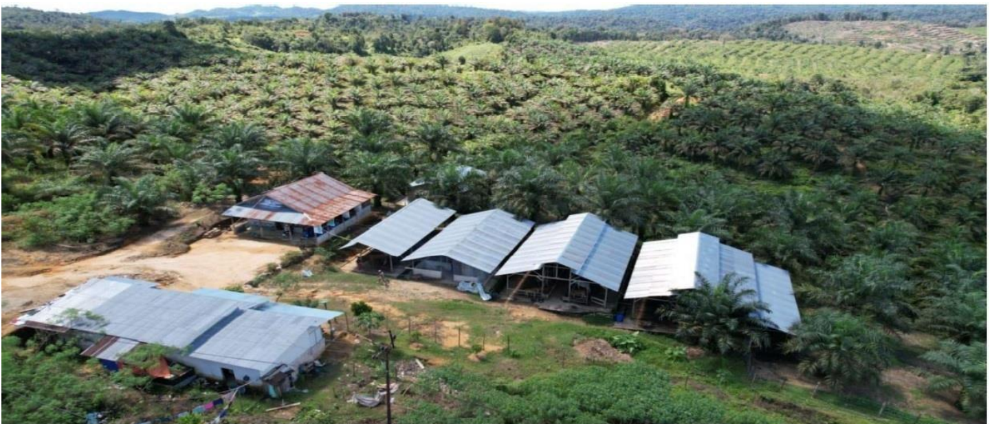
Gambar 1. Lokasi Peternakan I

Pendirian perusahaan berdasarkan Akta Notaris dari Notaris Mulyana, SH., MKn. dan SK Kemenkumham yang sah secara hukum. Saat ini PT. Ghaffar Farm bersaudara melakukan pembangunan peternakan secara progresif pada lahan seluas 12 hektar di daerah Tanjung Balik, Pangkalan, Kabupaten Lima Puluh Kota, Sumatera Barat dengan konsep peternakan integrasi sawit dan sapi. Ghaffar Farm juga memiliki lahan peternakan modern di Buluh Kasok, Kecamatan Harau, Kabupaten Lima Puluh Kota seluas 12 hektar. Kepemilikan lahan adalah milik perusahaan yang sah secara hukum berdasarkan akta notaris.